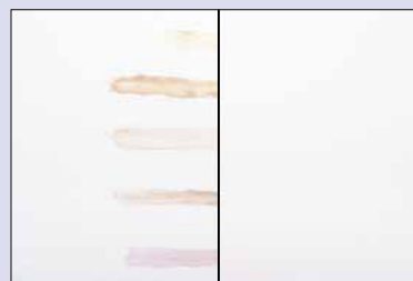
hochwertige matte Innenfarbe PremiumClean