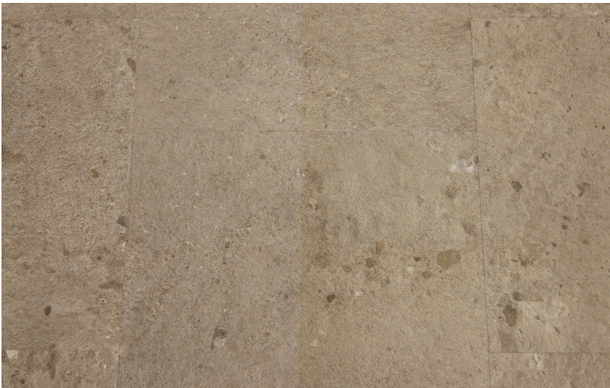
Abbildung 4: nach 25 Wischvorgängen mit eingefärbter PU-Reiniger-Lösung; links: PU Anticolor seidenmatt, rechts: unversiegelt