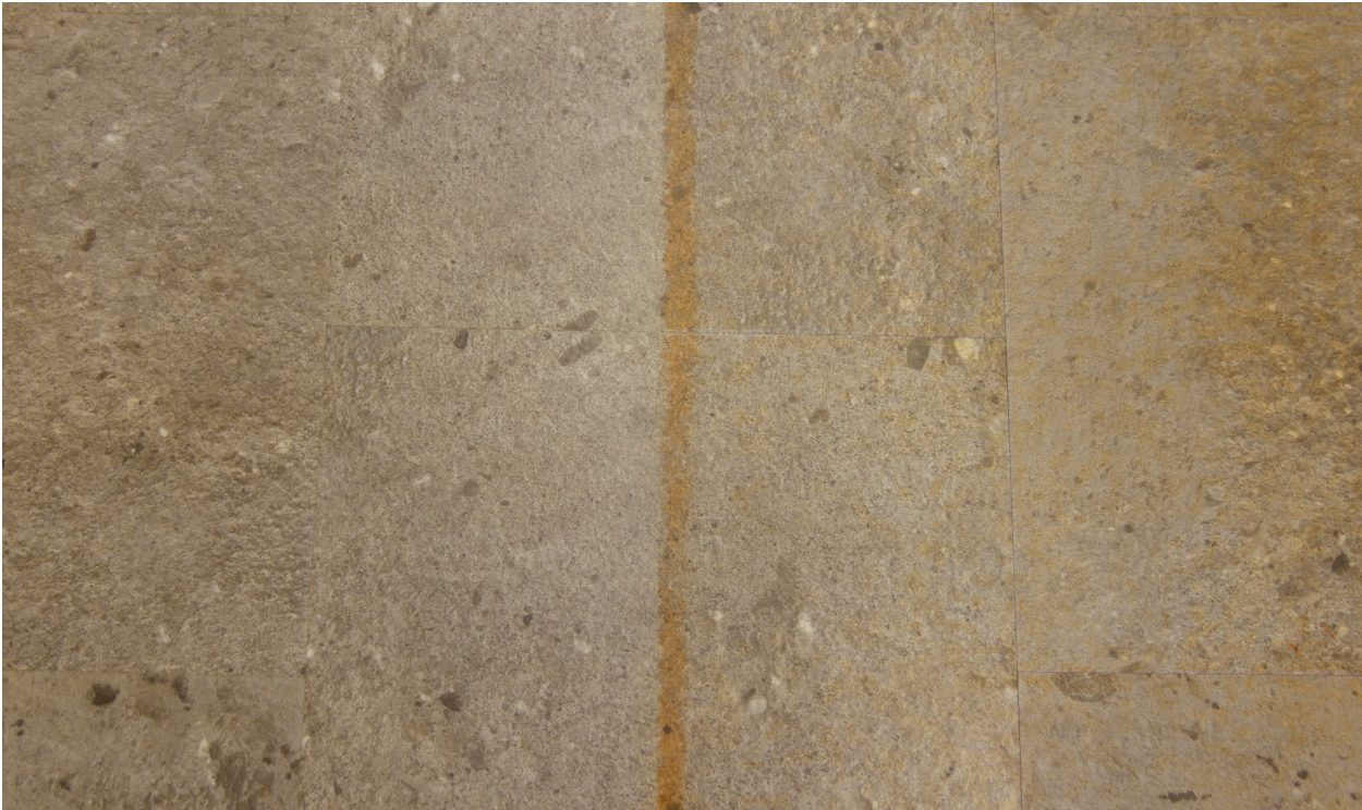
Abbildung 3: nach 25 Wischvorgängen mit eingefärbter Desinfektionsreiniger K-Lösung; links: PU Siegel seidenmatt, rechts: unversiegelt

Die versiegelten Prüfflächen zeigen neben dem dichten Fugenverschluss eine deutlich geringere Anschmutzung durch die eingefärbte Behandlungsmittellösung im Vergleich zur unversiegelten Referenzfläche.